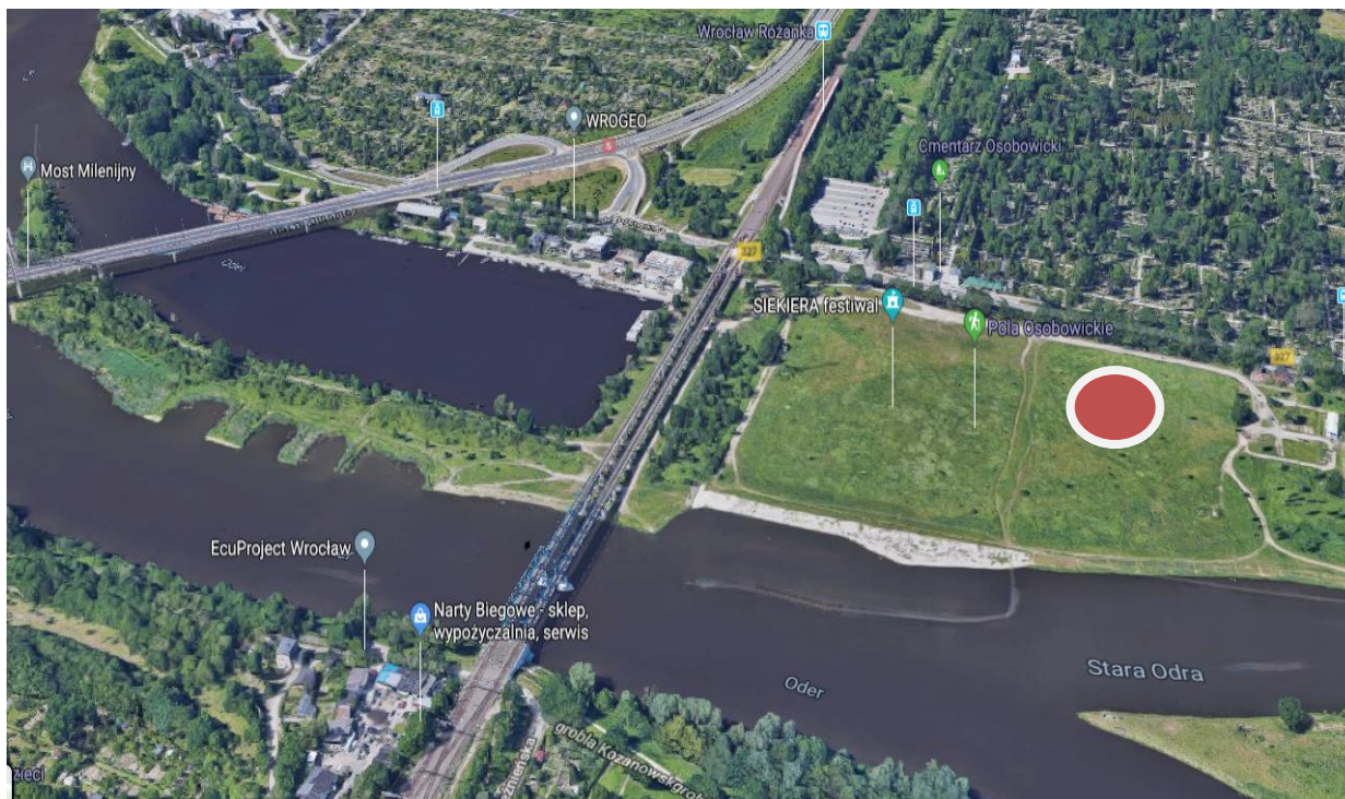
Wroclaw, Baza Las Pegas, Ulica Osobowicka, ca. 400m östlich oberhalb der Eisenbahnbrücke (roter Kreis)

Anreise Baza „Las Pegas“ Wroclaw, ul. Osobowicka: Ab Mo. 05.06.2023 (nachmittags) erreichen die Teilnehmenden des 1. Abschnittes und die Starter mit Beginn „Wroclaw“ mittels eigener Anreise das Biwak. Für Teilnehmende, die ihr Fahrzeug nicht in Wroclaw parken möchten besteht folgende Variante: Anreise nach Wroclaw am 05.06.2023, dort zelten und am nächsten Morgen das leere Fahrzeug nach Schwedt umzusetzen und mittels kostenpflichtigen Bustransfer zurück nach Wroclaw kommen.